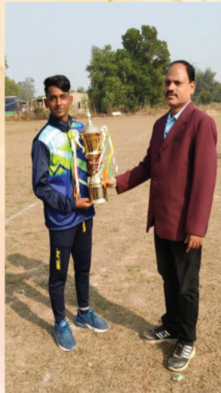
WINNER TROPHY EAST ZONE INTER UNIVERSITY KHO KHO